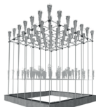
RÉCIF FILIERE HAUTE