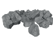
RÉCIF AMAS DE BLOC ROCHEUX