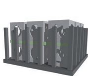
RÉCIF PANIER FAKIR