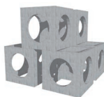
RÉCIF AMAS DE CUBES