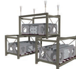
RÉCIF PANIER ACIER